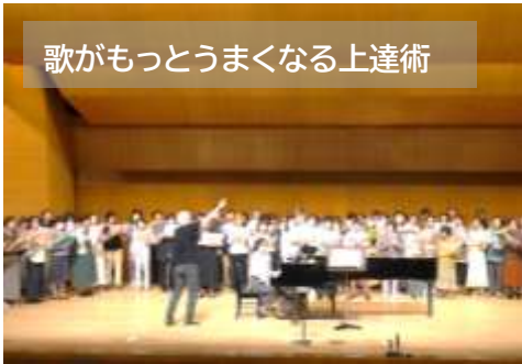
歌がもっとうまくなる上達術

◆6月開催分の「春の講座」フォトレポートです。(一部のみ)先生方、ご参加のみなさん、ありがとうございました。