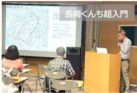
長崎くんち超入門