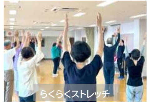
らくらくストレッチ