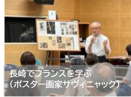
長崎でフランスを学ぶ(ポスター画家サヴィニャック)