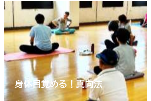
身体目覚める!真向法