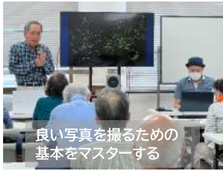
良い写真を撮るための基本をマスターする