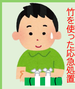
竹を使った応急処置