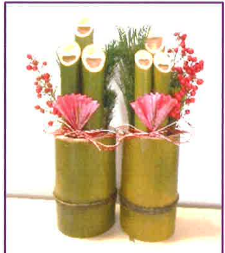
玄関にも置ける、高さ 30 cm で左右対のセット

NPO 法人環境保全教育研究所(へんちくりん) (長崎市田手原町 646 番地) 現地集合